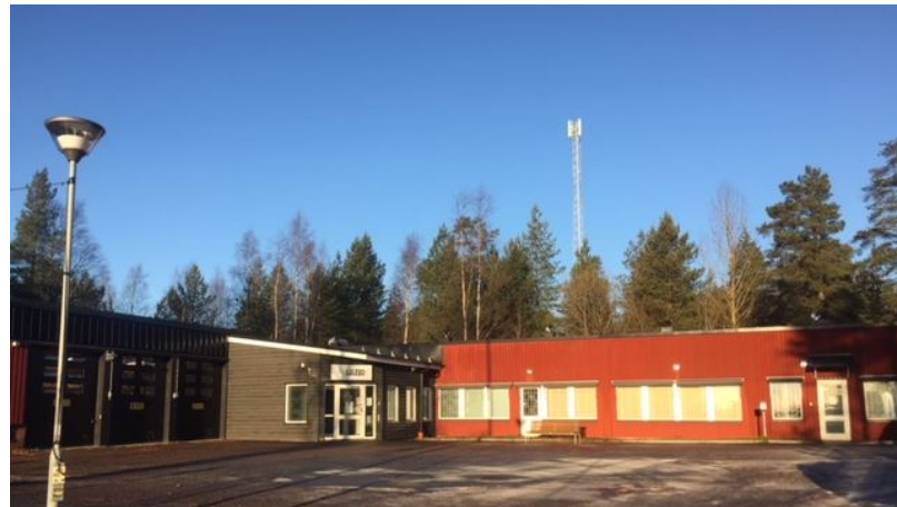
KONTOR, KONFERENSNUM OCH GARAGE.