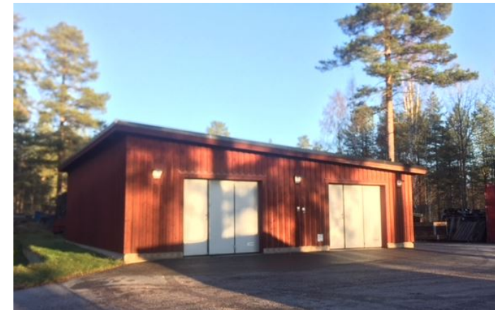
FRISTÅENDE GARAGE/ FÖRRÅDSBYGGNAD, 85 KVM.